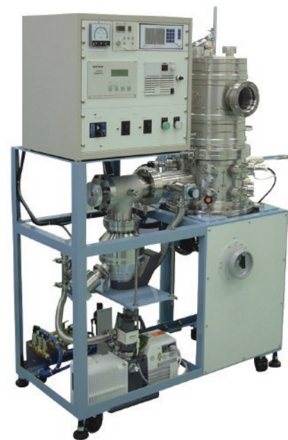
イメージ写真 (実際とは異なる場合がございます。)